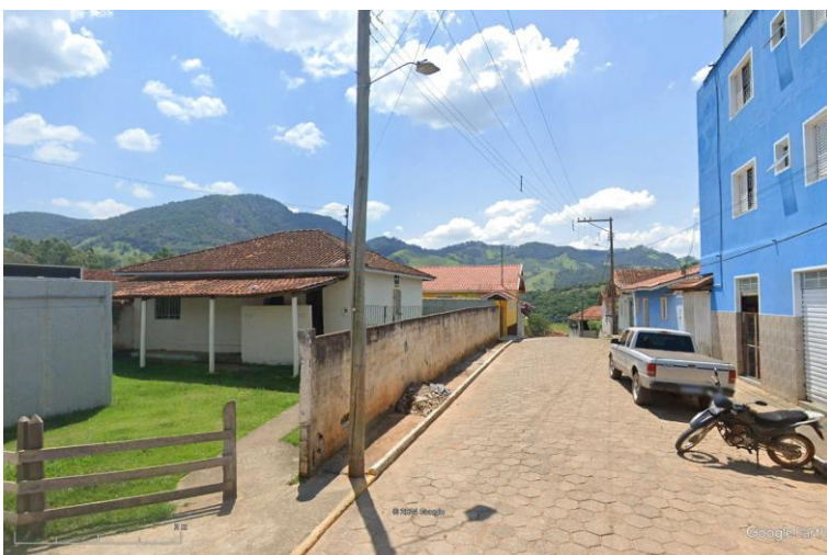
Figura 4 - Vista da Travessa Tobias Pereira (construções existentes serão demolidas pela prefeitura, muros serão mantidos)