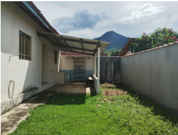
Figura 9 - Vista interna (manter muro)