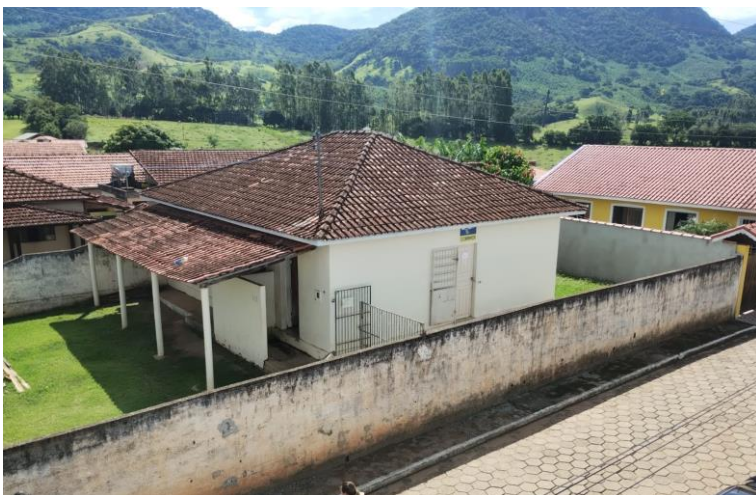
Figura 6- Vista do alto pela Travessa