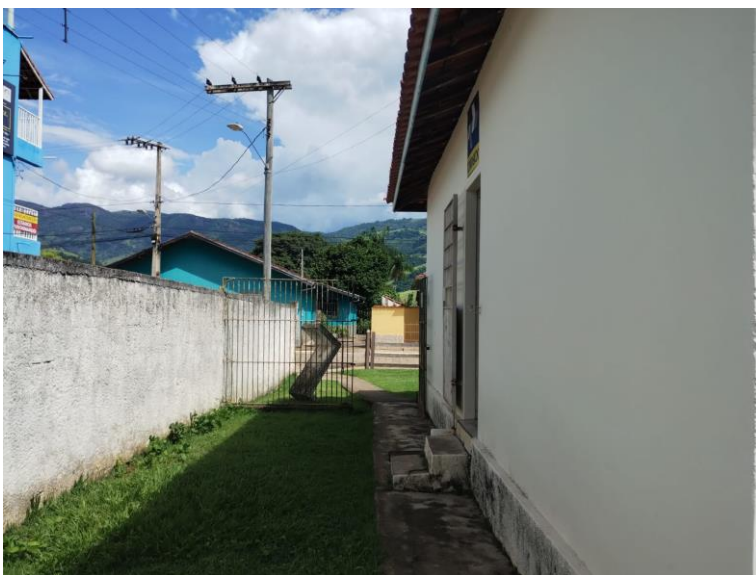
Figura 7 - Vista interna (manter muro)