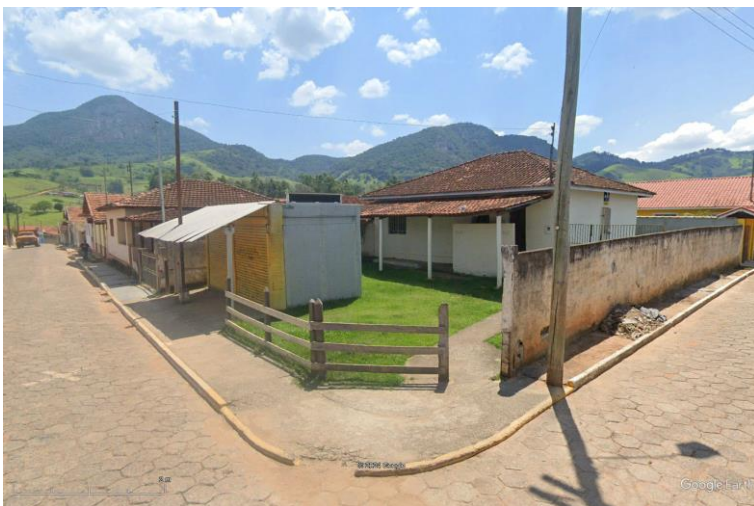
Figura 3 - Vista da esquina (construções existentes serão demolidas pela prefeitura)