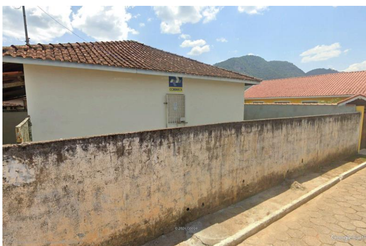
Figura 2 - Vista da Travessa Tobias Pereira (muro a ser mantido)