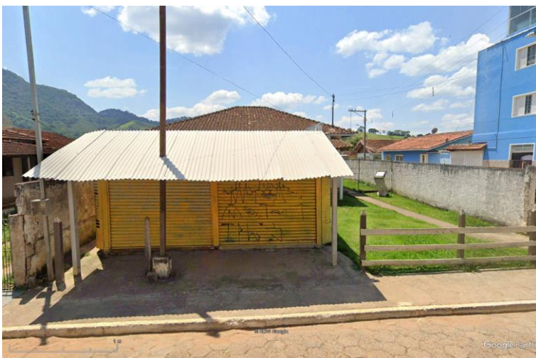
Figura 5 - Vista da Rua José Albano (construções existentes serão demolidas pela prefeitura, manter o padrão de energia para obra)