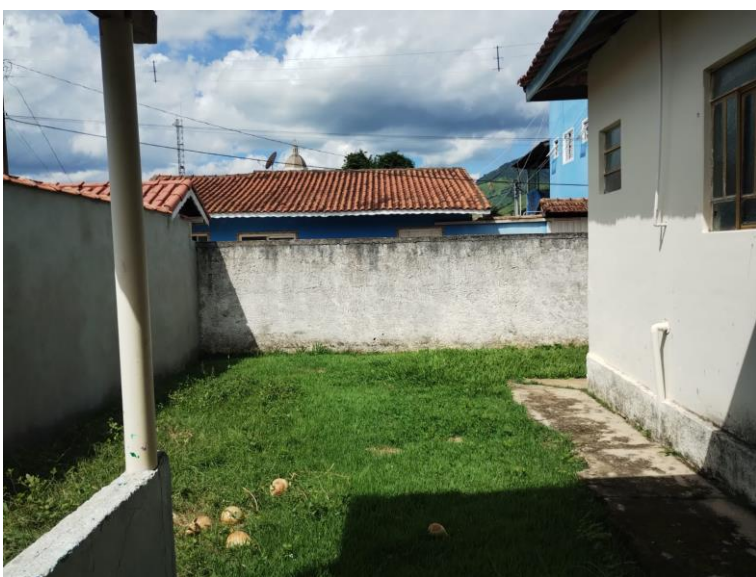
Figura 8 - Vista interna (manter muro)